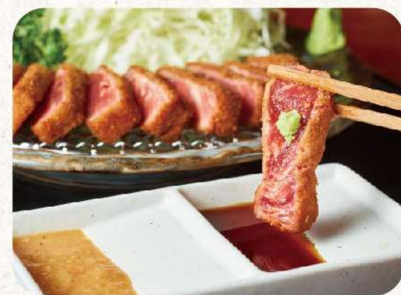
物 むと村 GF軽食/主題餐廳 炸牛元村