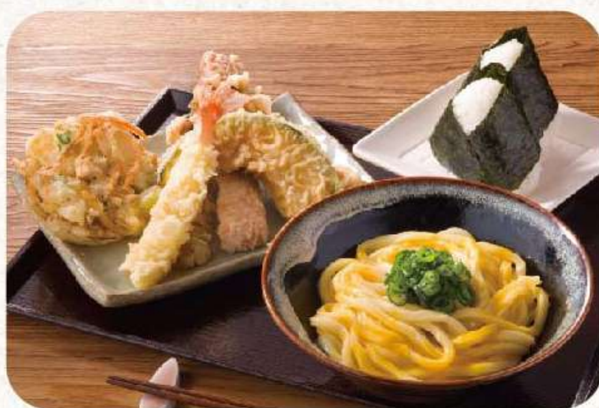
本場香川 宮武讃岐うどん 2F美食街 宮武讃岐烏龍麵