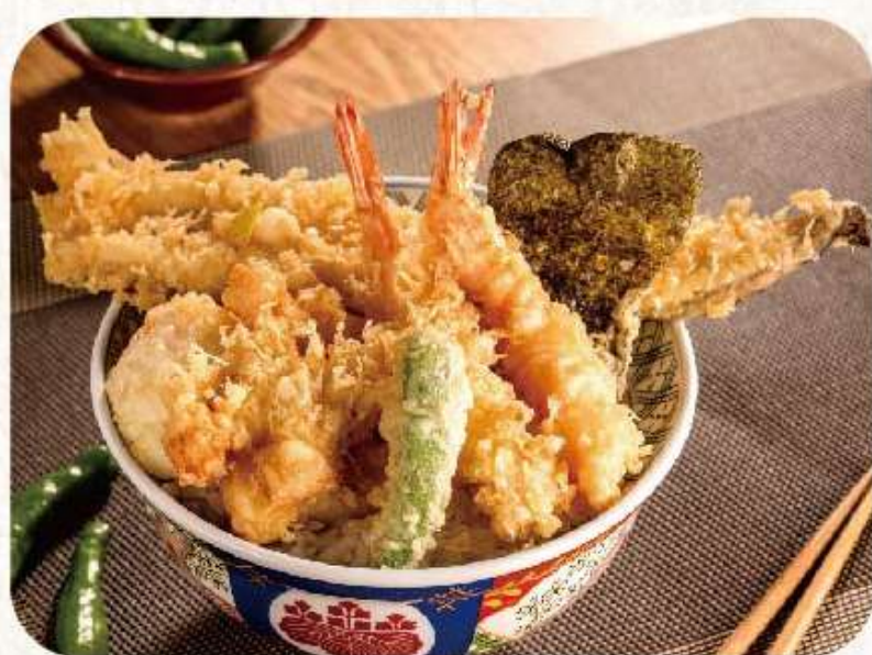
天井専門店 金子半之助 2F美食街 天井専門店 金子半之助

To add some gourmet elements to your one-day shopping trip, we have not only collected well-known brands around the world, but also introduced over ten Japanese gourmet cuisines.