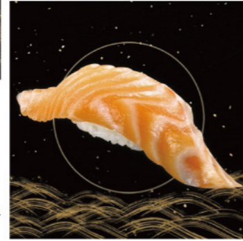
熟成鮭魚 推薦價 40元