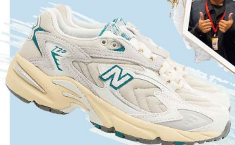
New Balance 725 (ML725ASV)

【新概念店】來自日本大型流行鞋靴通路，不僅商品優惠，在商品種類上也相當的齊全，除了各大流行品牌，ABC MART獨家品牌Abc select、Danner、Hawkins、Stefanorossi及Nuovo，品牌及商品屬性，提供全年齡的消費者合適商品！