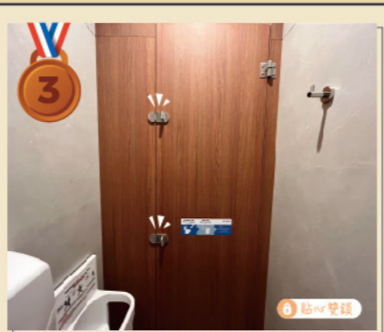
南北館廁所 親子Double check