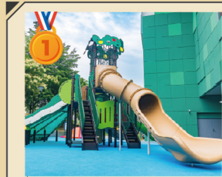
北館戶外區 小不點山丘