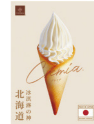
原味 推薦價 150元/支

CREMIA 使用 25% 的鮮奶油與乳脂肪含量高達 12.5%，入口像絲綢般滑順，每一口都吃得到牛奶的香濃，上質的濃醇口感絕對稱得上經典!