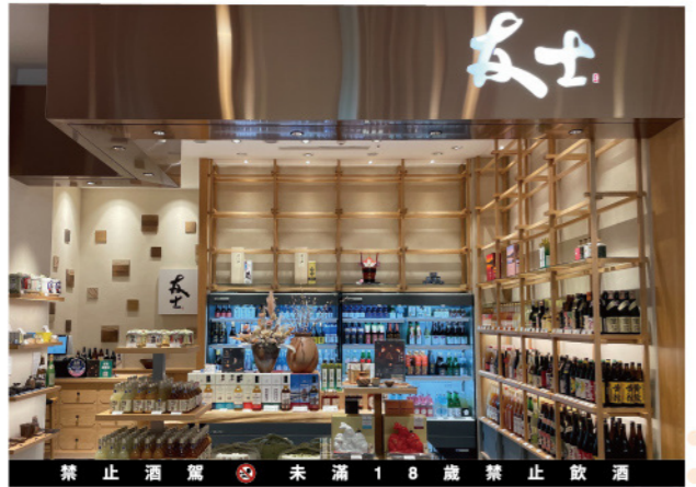
禁止酒駕 未滿 18 歲禁止飲酒