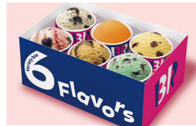
單球六入禮盒 推薦價 600元 單球 推薦價 110元

31冰淇淋的人氣冰淇淋禮盒!口味可以任選6種唷!不管現場享用還是帶回家都是最佳選擇!(外帶附贈30分鐘保冰服務)。