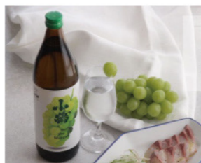
禁止酒駕 未滿 18 歲禁止飲酒

小鶴 the Muscat 使用熟成後的甘藷加上黑麴釀造，有如麝香白葡萄般的新鮮水果香氣，為一款令人聯想到綠色水果般清爽的燒酎。