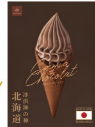
巧克力 推薦價 150元/支

CREMIA 使用 25% 的鮮奶油與乳脂肪含量高達 12.5%，入口像絲綢般滑順，每一口都吃得到牛奶的香濃，上質的濃醇口感絕對稱得上經典!