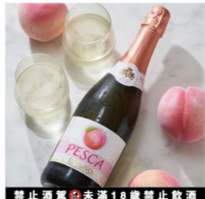
禁止酒駕 未滿 18 歲禁止飲酒